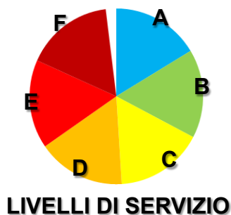
LIVELLI DI SERVIZIO